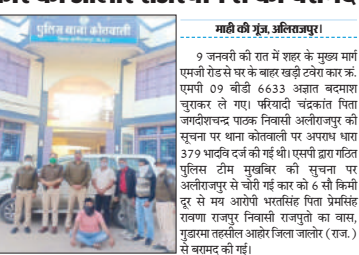
पुलिस बामनी कोतवाली