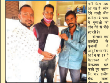
माही की गूंज, पेटलावद।

बेरोजगारों को लोन देकर उनकी रोजगार उपलब्ध करवाने की शासन की मीशा पर