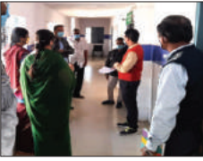
माही की गूंज, सारणी राज्य प्रदायक