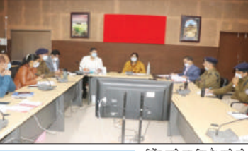
माही की गूंज, खरगोन। इस कार्य में गणतंत्र दिवस 26 जनवरी के अवसर पर पूरे की भांति सभी स्कूलों व कार्यालयों में झंडावंदन होगा, लेकिन इस बार स्कूलों विद्यार्थी